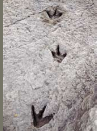
HUELLAS FOSILES DE DINOSAURIO. COMARCA DE LA RIOJA BAJA (VALLE DEL CIDACOS). LA RIOJA.

En la actualidad, existen entre 500 y 600 géneros conocidos y hay quien asegura que puede haber desde cinco hasta veinte o treinta veces más. En España también existen yacimientos de dinosaurios de gran valor. José Luis Sanz está al frente del de Las Hoyas, en Cuenca. Este humedal de hace 130 millones de años es uno de los más importantes para conocer el hábitat de los dinosaurios. Hace dos años apareció otro yacimiento en la zona, Lo Hueco, en el que se encontraron alrededor de 8.000 restos fósiles de dinosaurios en tan sólo cuatro meses. Se proyecta ahora un gran museo en Cuenca que abrirá sus puertas en pocos años.